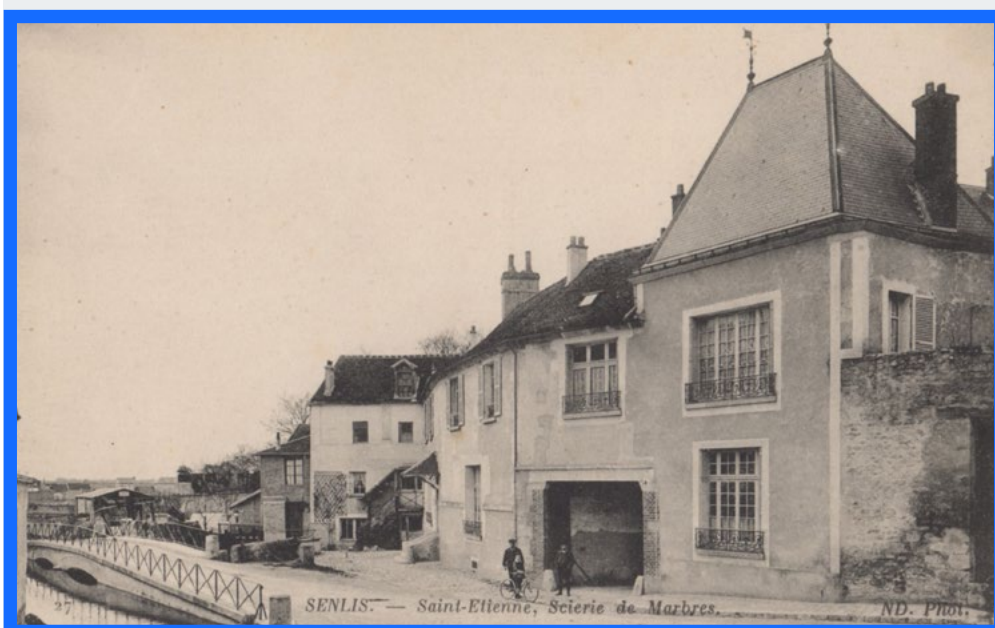
Scierie, rue du Moulin Saint-Étienne