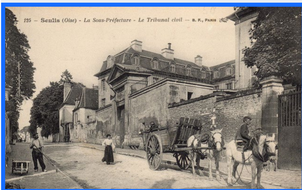
Rue de la République