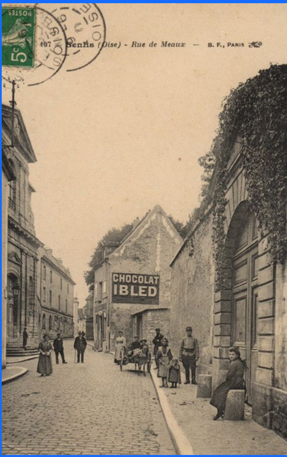
Rue de Meaux